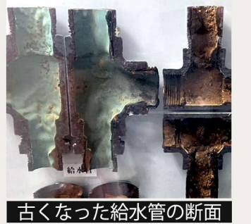
古くなった給水管の断面

築40年以上のマンションで、古くなった給水管の交換工事を行いました。給水管は長年使うと内側にサビがたまり、水の流れが悪くなったり、水質が低下したりすることがあります。そのままにしておくと、水漏れや赤水の原因にもなります。今回の工事では、古い配管を撤去し、新しい配管に交換。交換後に水圧試験を行い、安全に使えることを確認しました。その後、保温材を巻いて工事完了です。取り外した配管の断面を見ると、外側はきれいでも内側にはびっしりとサビが！見た目だけでは劣化が分かりにくいので、定期的な点検と適切な交換がとても大切です。あなたの住んでいるマンションの配管は大丈夫ですか？気になることがあれば、お気軽にご相談ください。